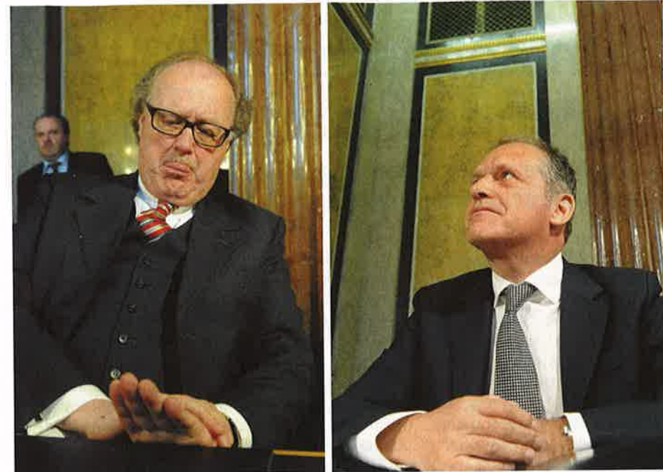
RAMPENLICHT. Bei prominenten Skandalen wie rund um Ernst Strasser oder Alfons Mensdorff-Pouilly sorgen Medien für Aufklärung – sie haben aber auch Einfluss auf Strafhöhe und Klima im Gerichtssaal.

Gibt es Unterschiede in der Wirksamkeit von Skandalen zwischen Onlinemedien und Zeitungen oder Magazinen? Mittlerweile tummeln sich ja Heerscharen von Privatreportern im Internet.